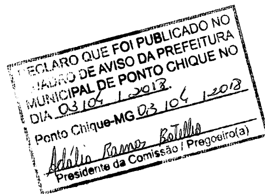
José Geraldo Alves de Almeida Prefeito municipal